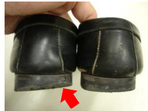
極端な靴の片減り